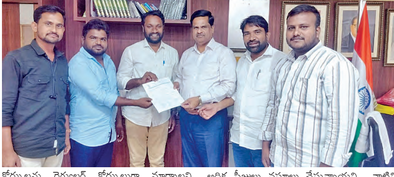
కోర్సులను రెగ్యులర్ కోర్సులుగా మార్చాలని కోరారు. రాష్ట్రంలో జాతీయ విద్యా విధానం-2020 అమలు చేసే పేద విద్యార్థులు ఉన్నత విద్యకు దూరమయ్యే ప్రమాదం ఉందని కాబట్టి రాష్ట్రంలో ఎన్ఎఫ్ఐ అమలు చేయొద్దని డిమాండ్ చేశారు. రాష్ట్రంలో అన్ని కొన్ని లిగ్నో అనంతరం సీట్ల పొందని విద్యార్థులు ఉన్నారని..